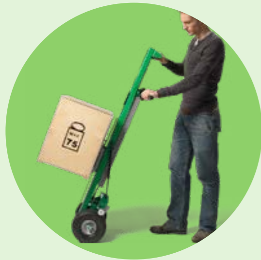
Diable à levée électrique