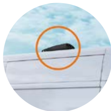
Ventilateurs de toit