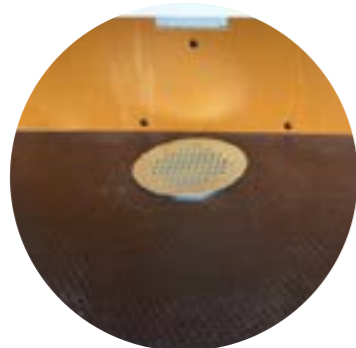
Aération au sol

Une ventilation suffisante et de qualité est d'une grande importance dans tout environnement, et en particulier dans les véhicules utilitaires. Pensez à votre santé et équipez votre véhicule utilitaire d'un système de ventilation mécanique ou électrique. Nous proposons différents systèmes de ventilation aérodynamiques pour le toit et le sol, qui sont alimentés mécaniquement ou électriquement.